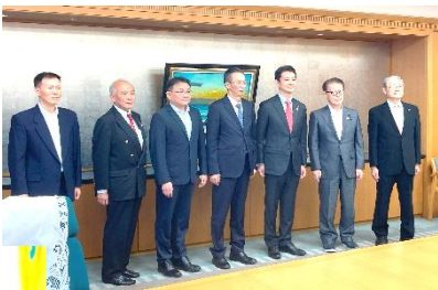
千葉県日中友好協会との懇談は、当協会の活動内容について説明