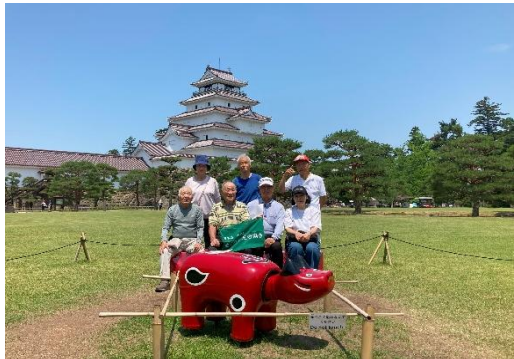
三千家茶道再興の地 麟閣を見学、鶴ヶ城バックに。