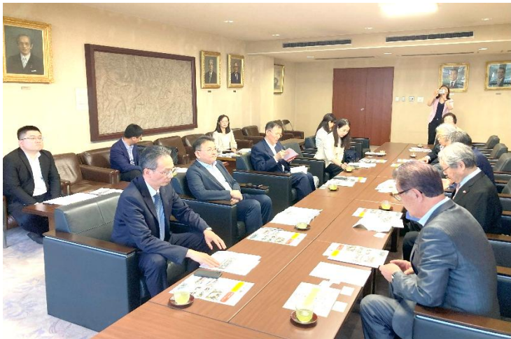
千葉県議会 応接室に会場を移し、じっくりと会談