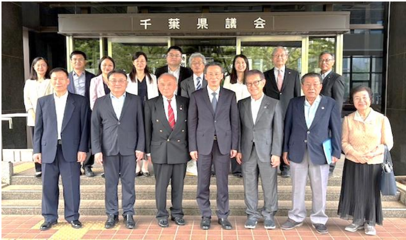
千葉県議会 玄関で記念写真