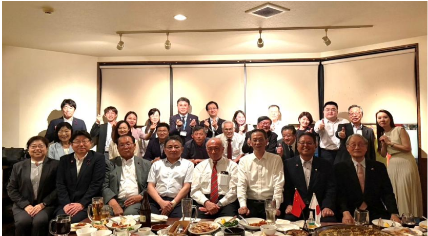
夕方からの歓迎懇親会は、スペイン料理で盛り上がる