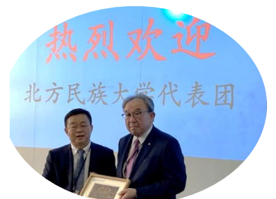
内苑副学長に記念品贈呈