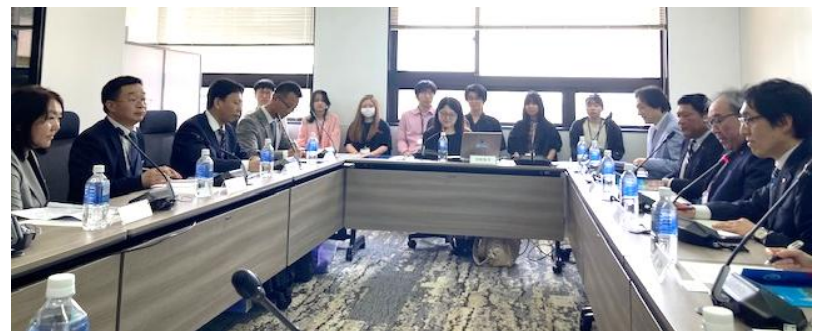
明海大学では「同時通訳室」にて交流、学生17名同席