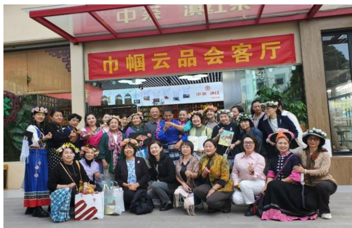
比ガウズは起承承の方々、ご記念写真