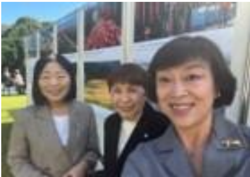
大使館庭園での展示の前で