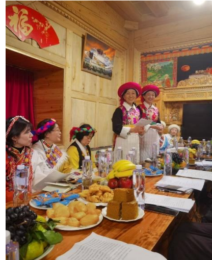
シャングリラのスームーさん民宿