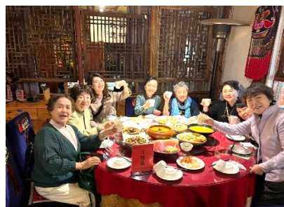
彝族(いぞく)料理の昼食

最後の昆明では、世界遺産の石林風景区見学、土曜日とあって、2車線一杯の幅を中国の観光客が延々と歩いて来られるを見て、中国人の力に圧倒されました。26の民族が暮らす雲南省では、白族、彝族など民族ごとの料理頂きました。文責 齋藤